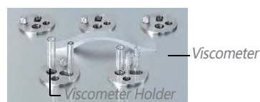
Flat Lid with Viscometer Holder