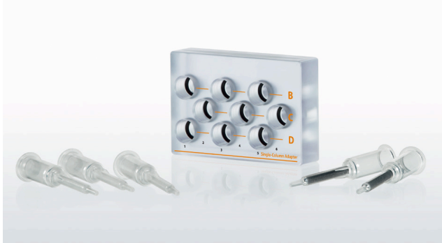
图 2: MultiMACS Cell24 Separator Plus 单柱适配器，可与 LS、LD 和全血分选柱配套使用。