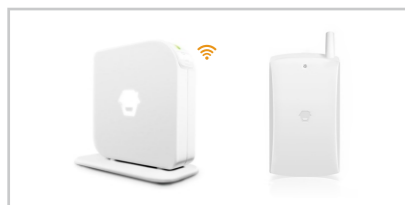
手机短信报警系统