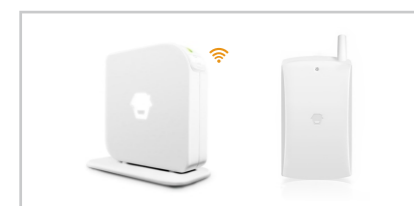
手机短信报警系统