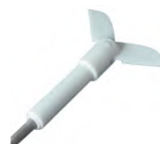
离心型PTFE涂层双叶片