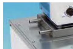
External Circulating Nozzle