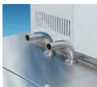
External Circulation Nozzle