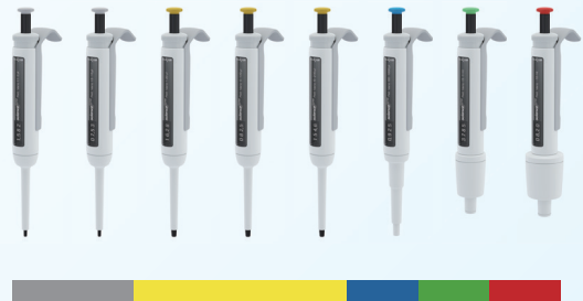
PETT Vario 可调量程移液器