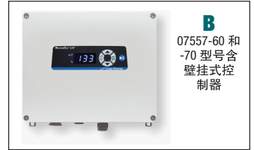
B 07557-60 和 -70 型号含 壁挂式控 制器