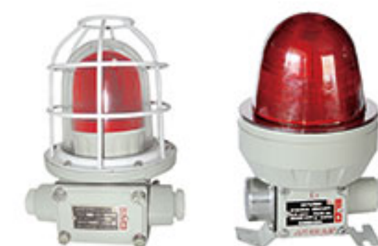
BBJ系列 防爆声光报警器