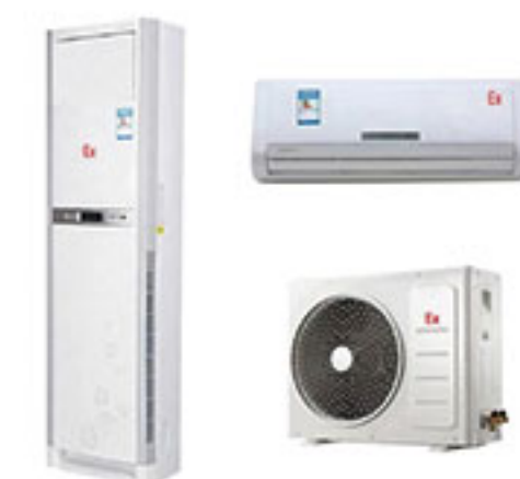
BK 系列 防爆空调