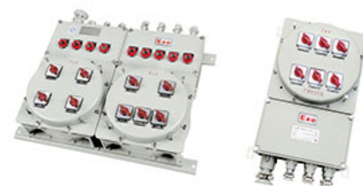
BXM (D/X) 系列 防爆照明 (动力/检修) 配电箱