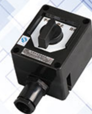
BZM8030系列 防爆防腐照明开关