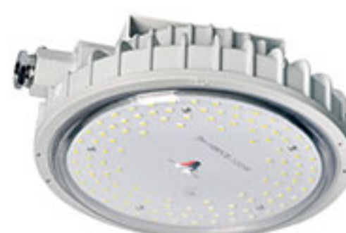
BED58系列 防爆免维护节能LED灯