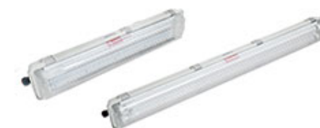
BYS系列 全塑防爆防腐荧光灯