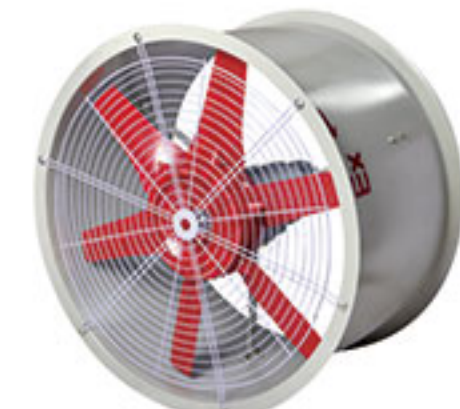
BT35系列 防爆轴流风机