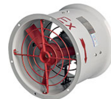
BAF系列 防爆轴流风机