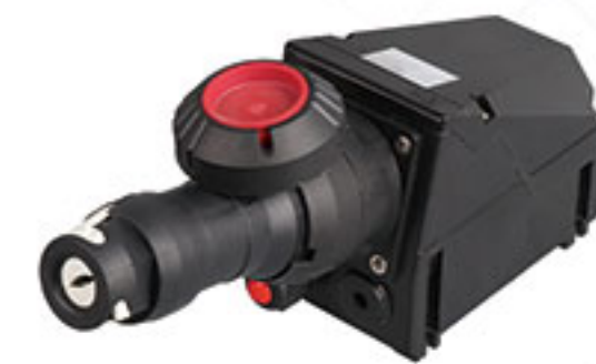
BCZ8030系列 防爆防腐插接装置