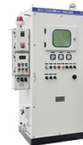
BPG51系列 正压型防爆配电柜