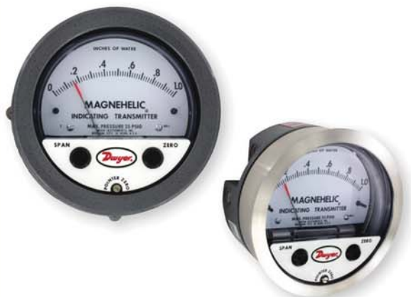
注意：显示的是-SS表圈选项。和 Magnehelic®差压表兼容。