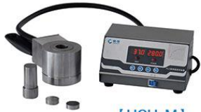
M1301 【HCH-M】 300°C圆柱电加热模具