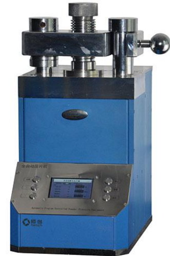
H0702 【FAP-60X】全自动荧光专用压片机