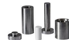
M0804 【HMC】圆柱形带刻度模具