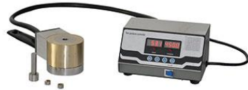
M1302 【HCH-G】 500°C圆柱电加热模具