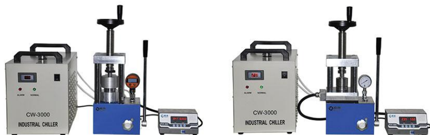
H1001 【YPH-600A】圆柱形电加热压片机