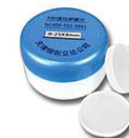
F0108 【HF-7A】 溴化钾窗片