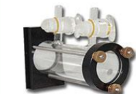
F0112 【HF-11】 红外气体池