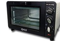
F0105 【HW-3】 红外烤箱