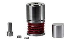
M0805 【HMS】双向加压开瓣模具