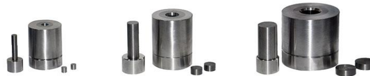
M0901 【HMW系列】硬质合金模具