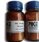
F0111 【PIKE】 溴化钾光谱纯