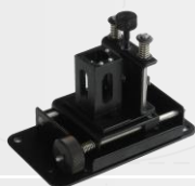
可调式微量单联池架