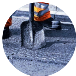
柏油 沥青 渣油