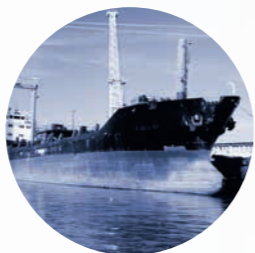
重燃油 船舰专用燃油 船用燃油