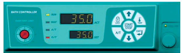
精确的数值设置和显示