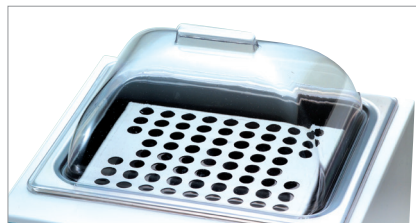
透明聚丙烯山形顶盖