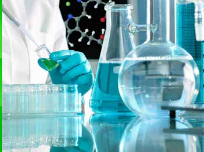
Thermo Scientific UV 800 实验室玻璃器皿清洗消毒机