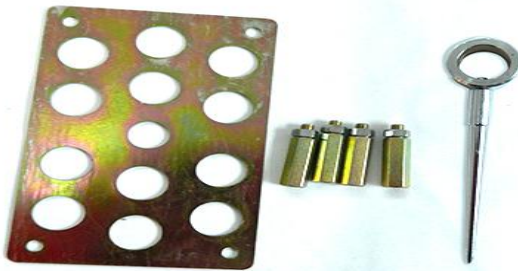
测杆托板/固定螺丝/风向标