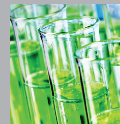
刑侦取证 & 生物科学

法医实验室 DNA 鉴定 Forensic DNA Identification 医学遗传研究 Medical Genetic Research 疾病预防公共卫生 Public Health Prevention 医院实验室基因筛选 Hospital Genetic Screening 考古实验室 DNA 提取 Archeology DNA Extraction