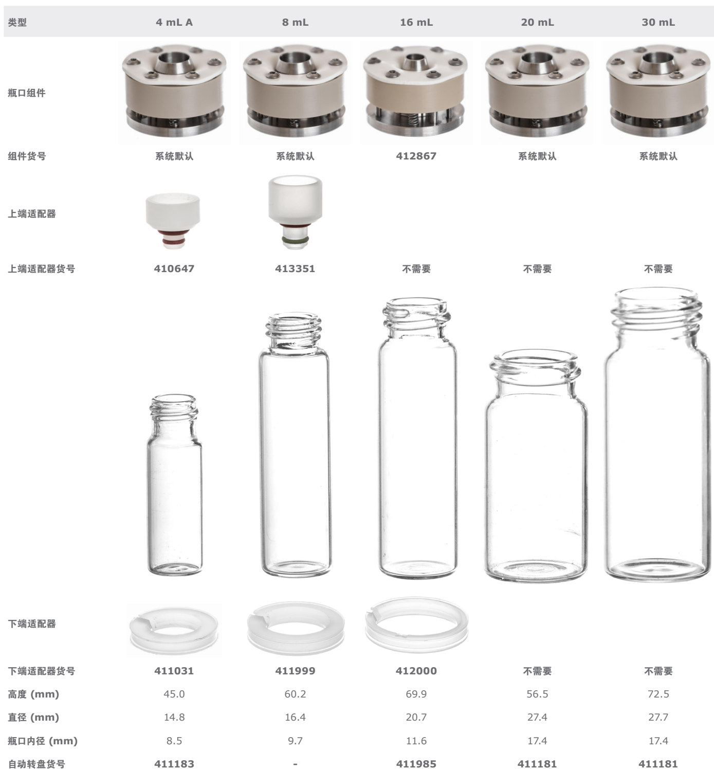
Table 1. Parts are depicted in true scale. Match your vial directly against the table and find your adapter part numbers.