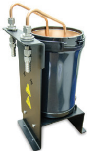
Chiller Dewar 循环液制冷系统

Chiller Dewar为高表面积铜线圈构成的封闭循环装置, 保证了杜瓦瓶与循环液体之间的高效热交换。温度则通过外配的循环浴来控制。