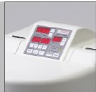
当球磨机盖子关闭后可对薄膜键盘进行操作