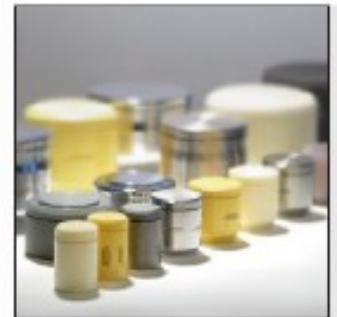
特别的多样性: FRITSCH 研磨碗制作