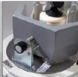
采用简易机械调整进行不平衡补偿