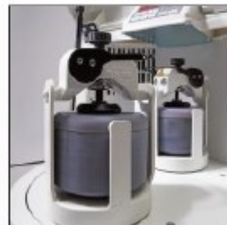
同时提供 P-5 经典型（双罐型）