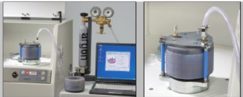
PULVERISETTE 4 惰性气体研磨