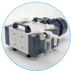
可选配针式入口气体过滤捕集阱（带调压调阀）