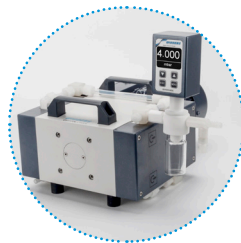
可选配数字式入口气体过滤捕集阱（带调压调阀）