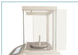
全透明玻璃罩, 样品100%可见