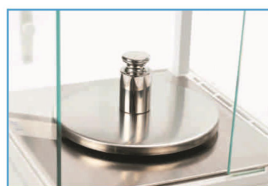
全不锈钢秤盘，让称 重物品稳定，不倾斜