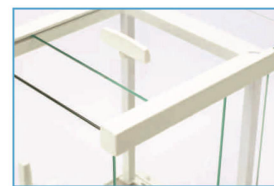
全透明玻璃罩，样品100%可见