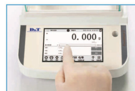
大尺寸触摸显示屏