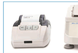
标准RS232双向通讯端口, 实现数据与电脑、打印机或其他设备之间的通讯