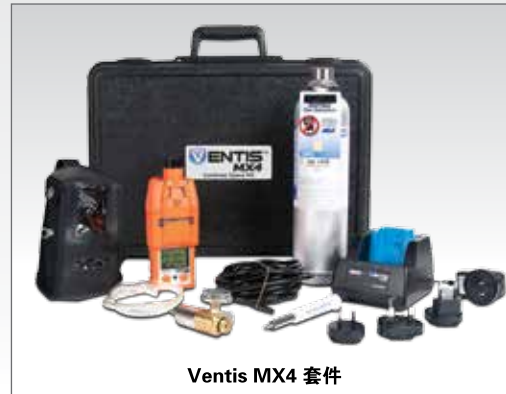
Ventis MX4 套件