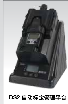
DS2 自动标定管理平台