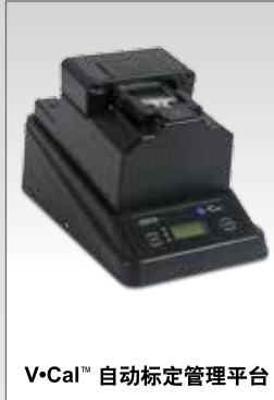
V-Cal™ 自动标定管理平台