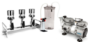
多联真空抽滤应用 选型详见 P25