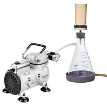
真空抽滤应用 选型详见 P20