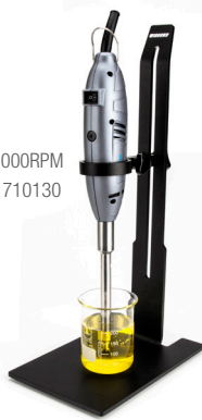
可选支架 订货号: 1710130-01