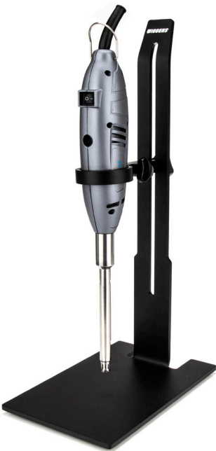
D-130 8000 ~ 30000RPM 订货号: 1710130