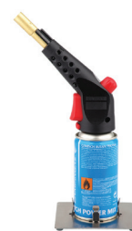
固定底座 订货号 : 6.000.816