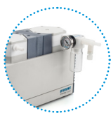
可选配指针式入口气体过滤捕集阱 (带调压调阀)