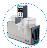
可选配数字式入口气体过滤捕集阱 (带调压调阀)