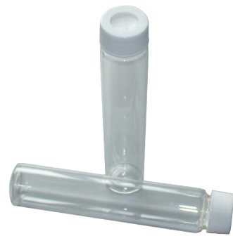
60ml收集瓶 (透明或棕色)