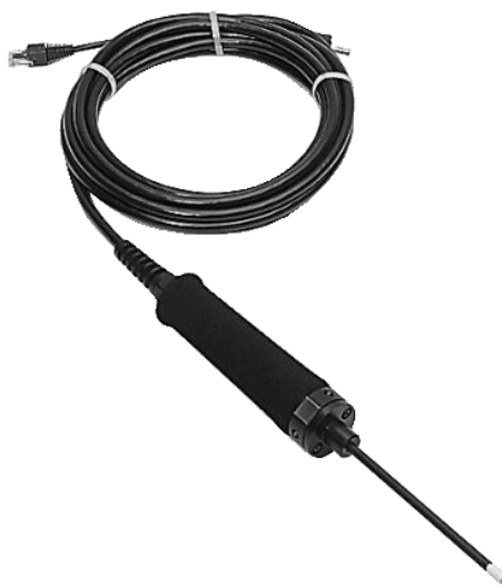
吸枪探头 LP 505