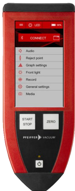
远程控制器 RC 500 WL