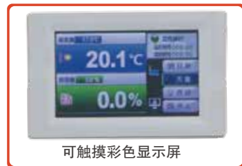
可触摸彩色显示屏