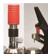
两种工作压头： 旋钮式和按压式