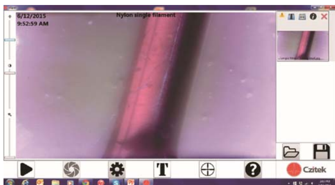
上图：纤维在ATR下得到的图像