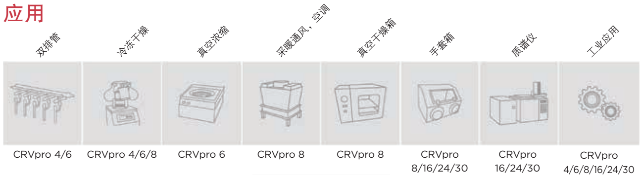
CRVpro 4/6 CRVpro 4/6/8 CRVpro 6 CRVpro 8 CRVpro 8 CRVpro 8/16/24/30 CRVpro 16/24/30 CRVpro 4/6/8/16/24/30