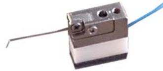
● 探针与磁吸底座 放大图