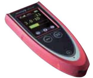
远程控制器RC 500 WL

ASM380可以使用RC 500 WL远程无线控制器进行操控。这就使得操作人员在100m以内的距离内都可以实现对检漏仪的操控。