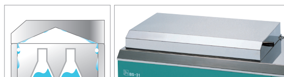
特殊的山形顶盖式设计，可以保护样品免受污染