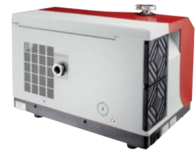
ASM 340 I