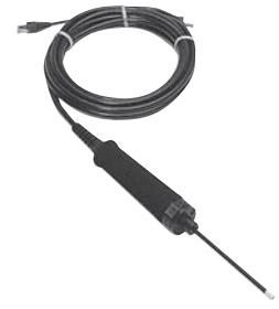
吸枪探头 LP 505