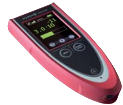
远程控制器 RC 500 WL

作为一种拓展，ASM 340 也可不配备前级泵。这款 ASM 340 I 允许连接不同的前级泵，以更方便地使用和更好地适应客户应用，例如在集成到检漏系统的情况下。外部前级泵的连接位于检漏仪的后部。