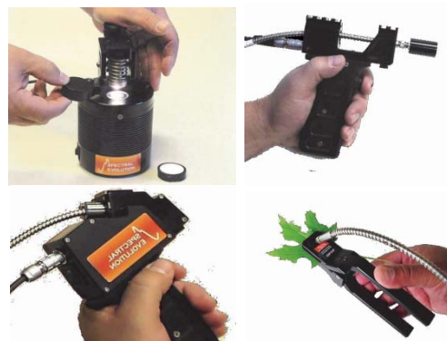
多种附件可根据实验需求选配