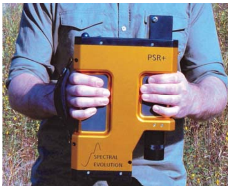
多种镜头和光纤可在野外方便更换