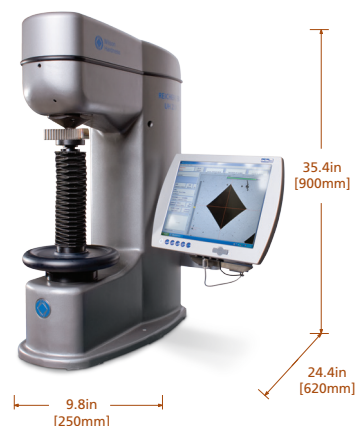
Approx. Weight: 507 lbs [230kg]