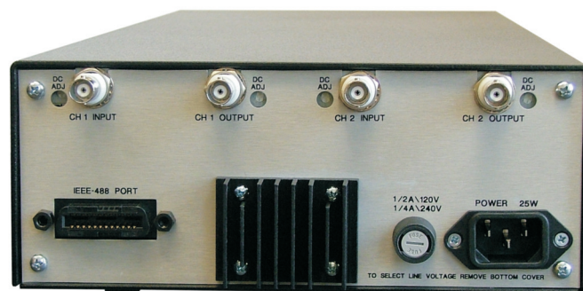
3940 Rear Panel View