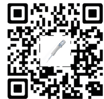
扫描二维码了解更多

访问液体处理专业网站，了解更多移液方法和技术： www.eppendorf.com/pipetting