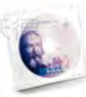
HI9298194 专用数据管理软件