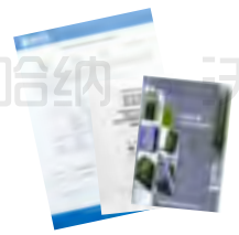
出厂报告及中英文说明书