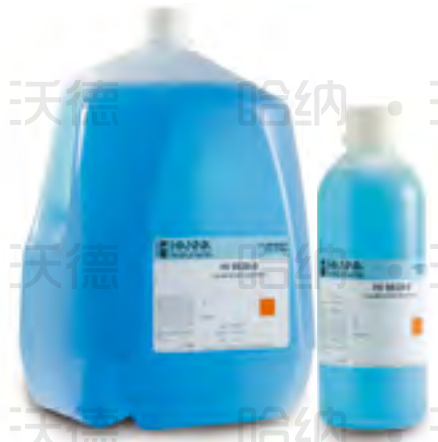
专用酸度 pH-电导率 EC 标准校准液

* 将 HI9828-0 校准液倒入专用校准杯内,安装在电极上,选择快速校准功能,也可另外选择多点校准模式。