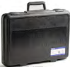
定制专用坚固耐用携带箱