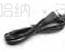
HI920015 USB 数据连接线