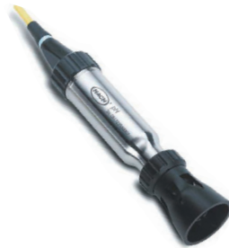
坚固型电极： 现场使用