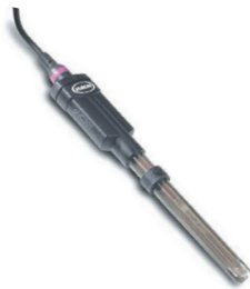
标准型电极： 实验室使用