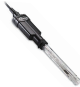
Ultra pH 电极： 纯水使用