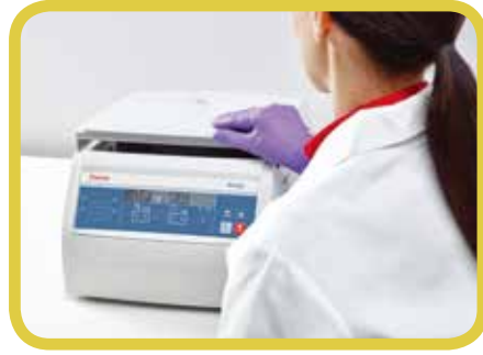
快速的离心腔盖关闭机制