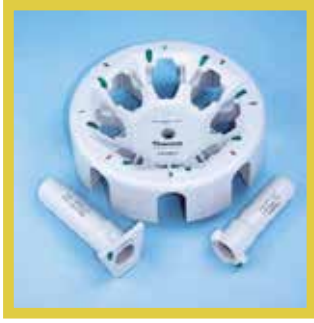
独特的DualSpin二合一 嵌合式转头设计