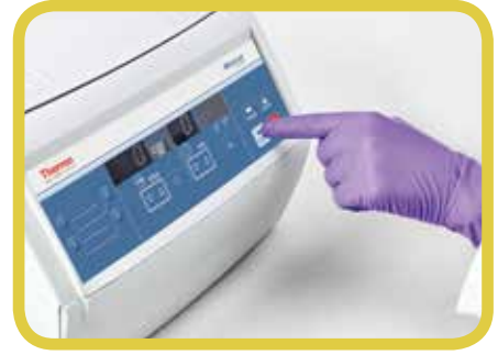
直观的控制面板，大且明亮的显示屏