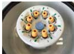
DualSpin转头，带水平转头吊篮