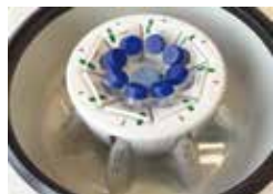
DualSpin转头，带角转头吊篮