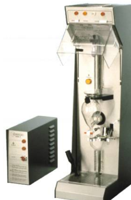
DEEPV + VADE