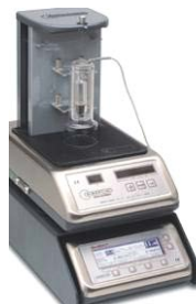
Densimat-CE + Alcomat2