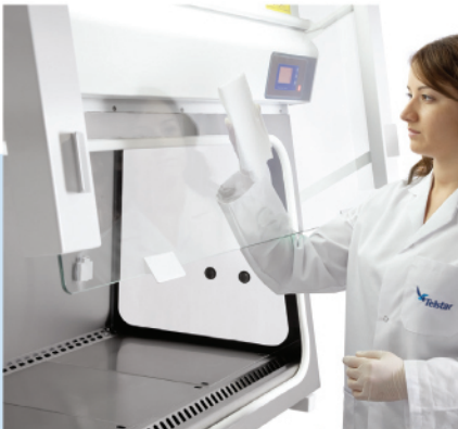
易于清洁玻璃内面

Bio II Advance 有一个可简单快速查看安全柜参数的炫彩屏幕。此可视面板可显示过滤器堵塞等级，此信息对与安全柜的后期使用维护非常有用。此显示屏还可一直显示控制安全柜状态的层流速度。