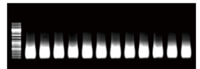
Figure 1. The Bioruptor® achieves highly consistent fragmentation that ChIP requires in the shearing of chromatin DNA complexes.

可更有效冷却因为仪器启动产生的热, 延长仪器使用寿命, 增进超声效率以及结果的一致性, 电磁阀可与超声仪连动, 超声仪启动时暂停冷却水循环, 超声仪暂停时启动冷却水循环, 完全不干扰超声波的传递