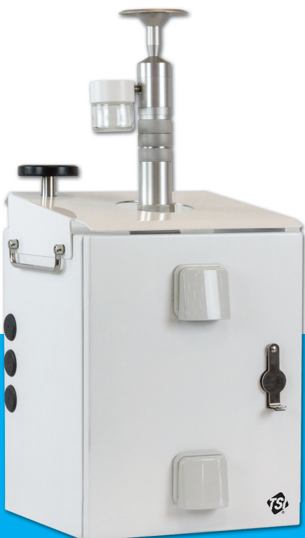
全天候远程实时颗粒物在线监测仪