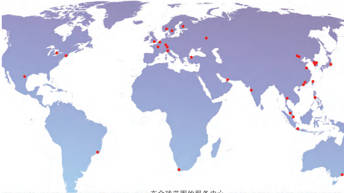
在全球范围的服务中心

朗铎科技，全球科学服务领域的领导者-赛默飞世尔科技（Thermo Fisher Scientific，纽交所代码TMO，原美国热电公司）中国区域战略合作伙伴。作为工业与实验室分析仪器系统解决方案服务商，我们致力于为中国客户提供全球高品质的分析仪器、专业的应用技术支持、优质的售后服务等系统解决方案。