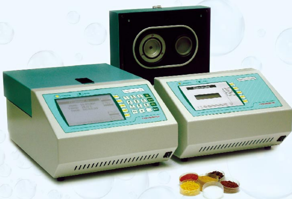
控温型 水分活度仪