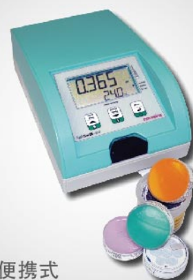
便携式 水分活度仪