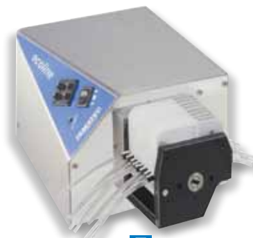
E 迷你卡盘泵 78022-40