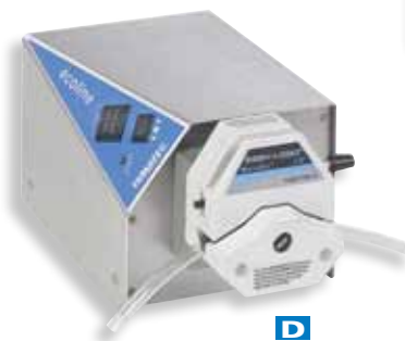
D Easy-Load 泵 78022-50