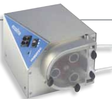
B 单通道三辊泵 78022-20

具有8通道或4通道迷你卡盘泵头。弹簧承载盒（随附）无需调整即可在任何时候提供最佳的咬合。（订购带咬合调节功能的承载盒来改变每个通道的压力。）6辊头和12辊头确保低脉冲和一致的流量。通过模拟输入信号 (0-5 VDC, 0-10 VDC, 0-20 mA 或 4-20 mA) 远程控制驱动器速度；通过触点闭合 (8-针 DIN) 启动/停止驱动器或反向输送。可使用您现有设备的输入信号来启动驱动器。