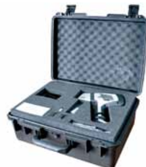
原厂标准手提防振箱