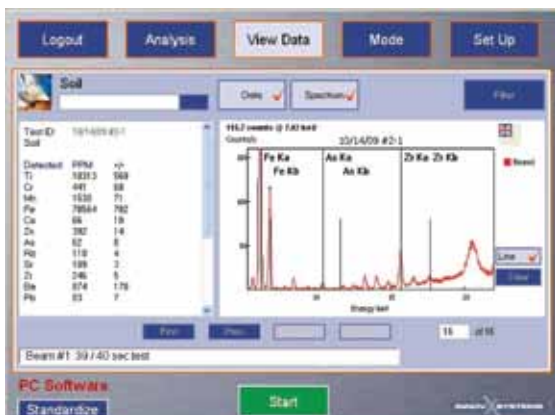
PC机软件加强了DELTA的性能