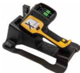
插接站及其充电设备